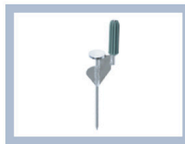
Estaca para clavar en el suelo y asegurar el Flag System, como por ejemplo, en el césped.