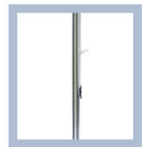
Asa para sujetar la cuerda de la bandera.

INSTRUCCIONES – VEA LA PELÍCULA COMPLETA EN WWW.EXPOLINC.ES